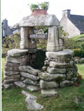
Puits à Locuon

Départ : D1 Mellionnec Chapelle de Saint-Auny D2 Ploërdut Locuon Eglise Saint-Yon