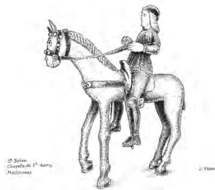
Statue de saint Julien à Saint-Auny