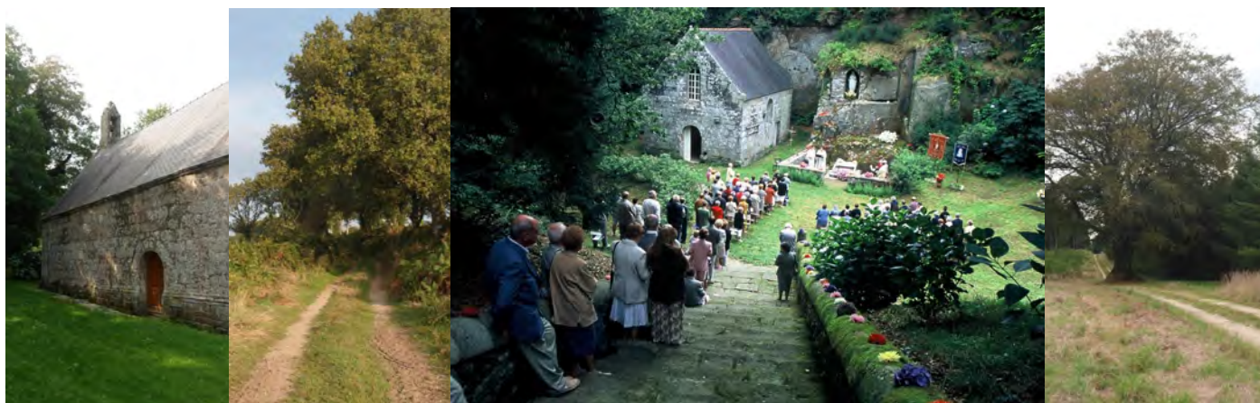
Saint-Auny, Hent Ahès, le pardon de N.-D. de la Fosse et le chemin du Launay à Villerit. Panneaux sur les sites historiques.