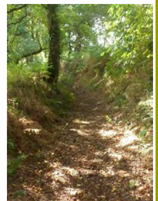
Chemin à Villerit