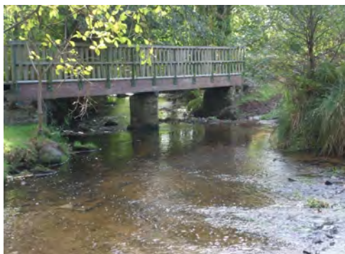
La passerelle du Moulin à tan sur le Scorff entre Locmalo et Ploërdut