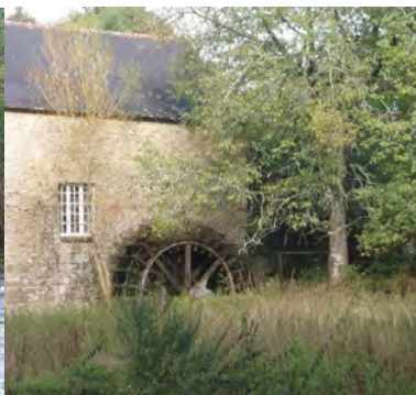
Le moulin Nicol