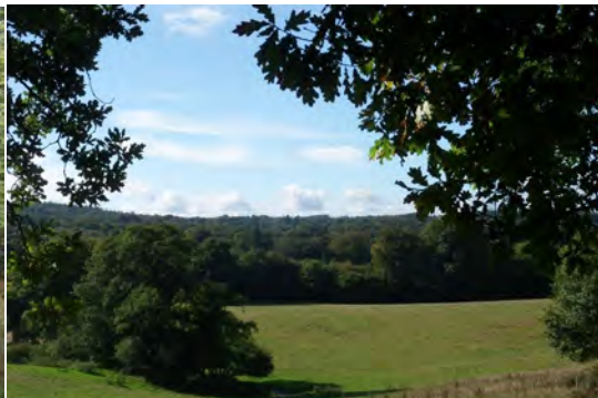
Vue panoramique à Tronscorff